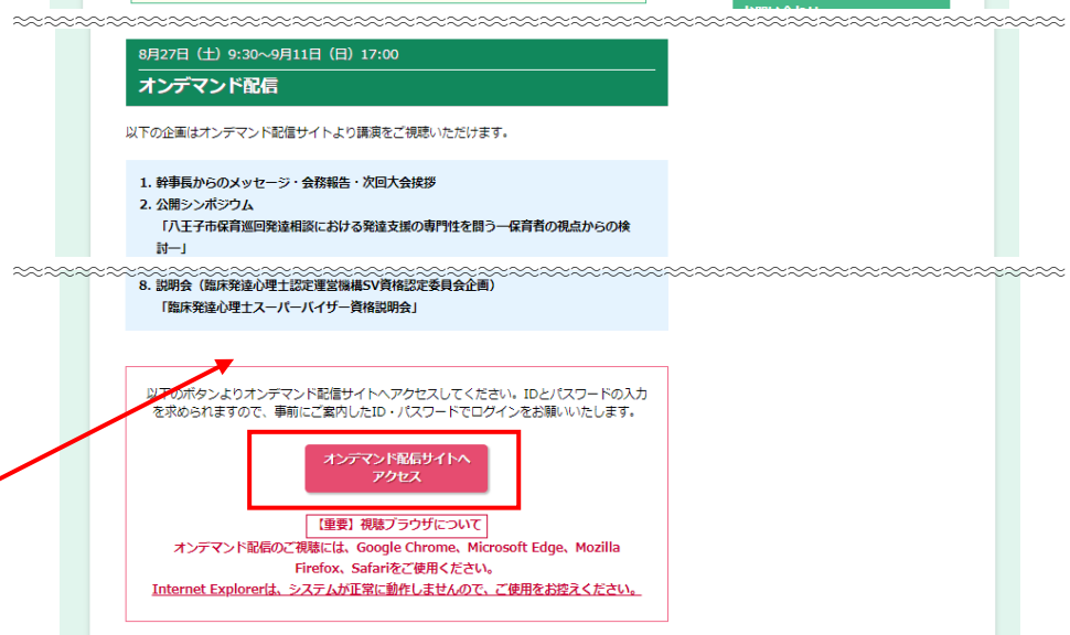
第18回全国大会特設サイト

オンデマンド企画は[オンデマンド配信サイトへアクセス]ボタンをクリックしてください(次ページの画面へ進みます)。