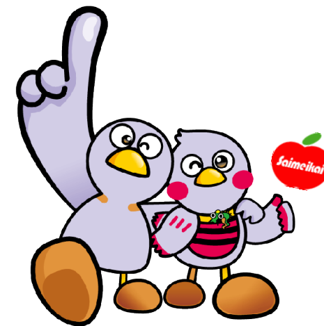
埼玉県マスコット『コバトン』『さいたまっちゃん』